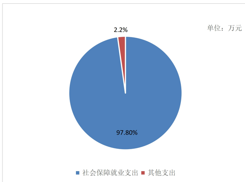
图 3: 2022 年支出构成（按支出功能分类）情况