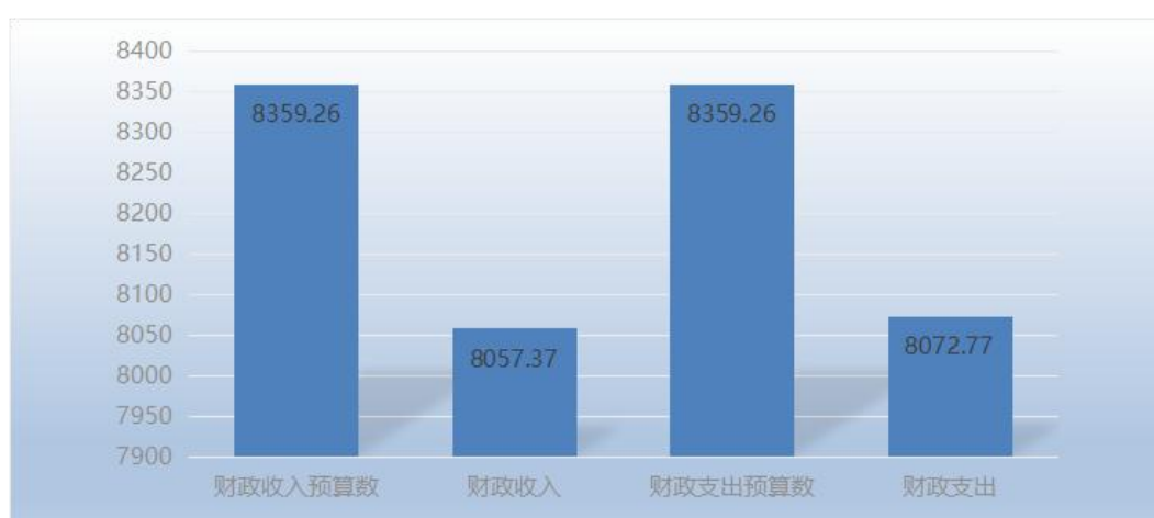
图 5：财政拨款收支与年初预算数对比情况

3. 国有资本经营预算财政拨款本年收入完成年初预算 0%，比年初预算增加 0 万元；支出完成年初预算 0%，比年初预算增加 0 万元。