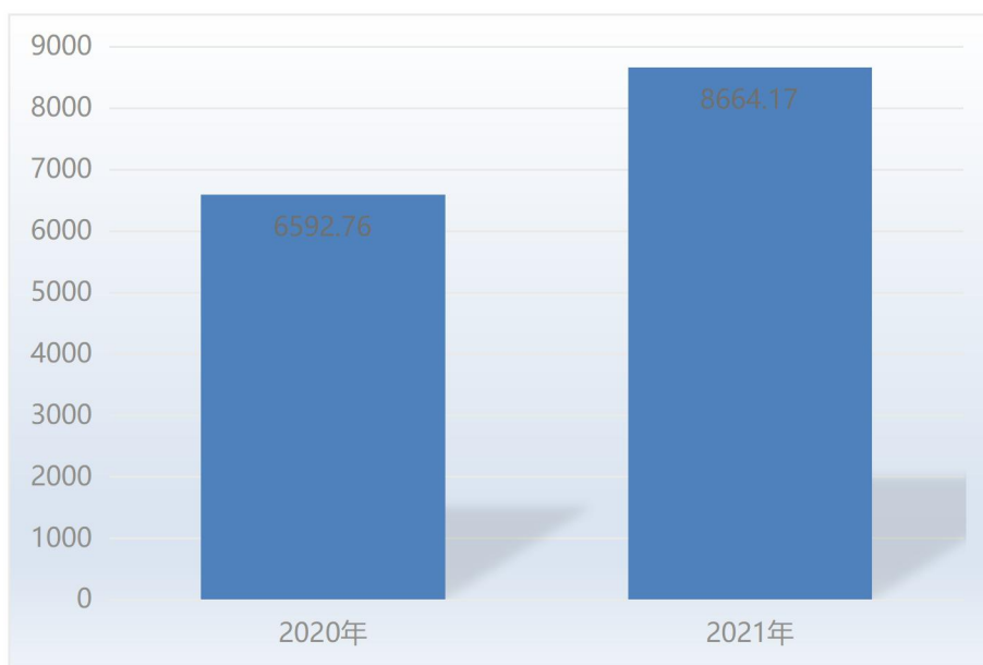
图 1：2020-2021 年收支总计对比情况

本部门 2021 年度收、支总计（含结转和结余）8664.17 万元。与 2020 年度决算相比，收支各增加 2071.41 万元，增长 31.4%，主要原因是增加了社区工作者工资、人才绿卡 AB 卡房租补贴及人才绿卡 A 卡生活补贴等专项资金。