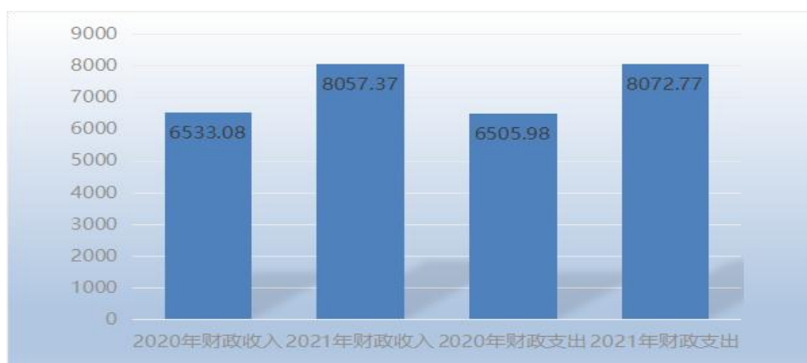
图 4：财政收支与上年决算数对比情况