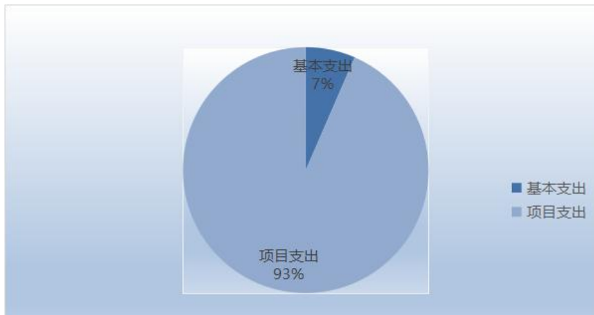
图 3: 支出构成（按支出性质）

2021 年度支出合计 8632.15 万元，其中：基本支出 577.52 万元，占 6.7%；项目支出 8054.63 万元，占 93.3%；经营支出 0 万元，占 0%。