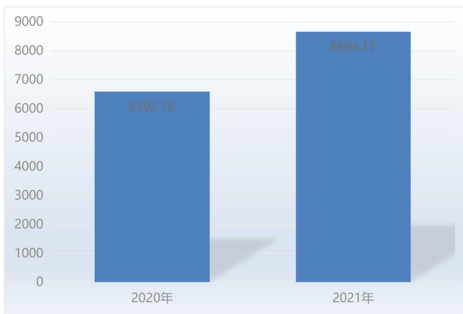
图 1：2020-2021 年收支总计对比情况

本部门 2021 年度收、支总计（含结转和结余）8664.17 万元。与 2020 年度决算相比，收支各增加 2071.41 万元，增长 31.4%，主要原因是增加了社区工作者工资、人才绿卡 AB 卡房租补贴及人才绿卡 A 卡生活补贴等专项资金。