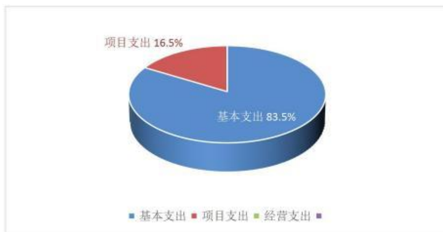
图三：支出决算构成情况（按支出性质）

本部门 2020 年度本年支出合计 293.32 万元，其中：基本支出 244.83 万元，占 83.5%；项目支出 48.49 万元，占 16.5%；经营支出 0 万元，占 0%。如图所示：