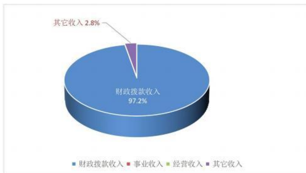
图二：收入决算构成情况

本部门 2020 年度本年收入合计 288.64 万元，其中：财政拨款收入 280.64 万元，占 97.2%；事业收入 0 万元，占 0%；经营收入 0 万元，占 0%；其他收入 8 万元，占 2.8%。如图所示