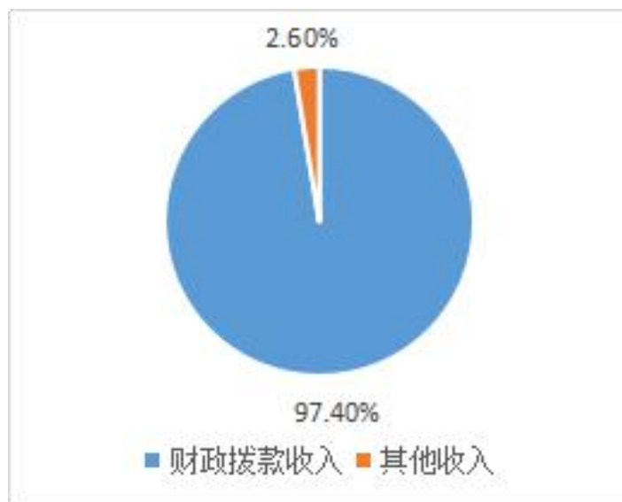
图 1: 收入构成情况

本部门 2018 年度本年收入合计 687.36 万元，其中：财政拨款收入 669.5 万元，占 97.4%；其他收入 17.85 万元，占 2.6%。如图所示：