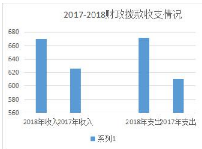
图 3: 2017-2018 财政拨款收支情况

款增加；本年支出 671.58 万元，增加 61.35 万元，增长 10.1%，主要是养老保险缴费增加。