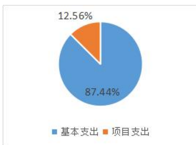
图 2：支出构成情况（按支出性质）